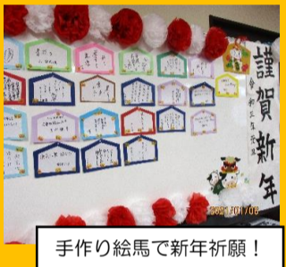
手作り絵馬で新年祈願！